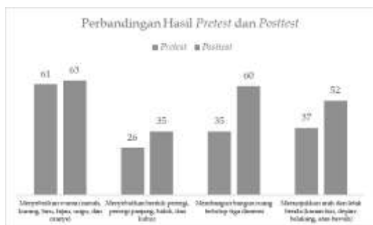
Gambar 7. Perbandingan Hasil Pretest dan Posttest

Pada tahapan ini, permainan BUMIKO VISPA diujicobakan pada 16 anak kelompok B usia 5-6 tahun di TK Khadijah Ahmad Yani Surabaya. Adapun perbandingan hasil pretest dan posttest per indikator disajikan dalam bentuk grafik pada gambar 7.