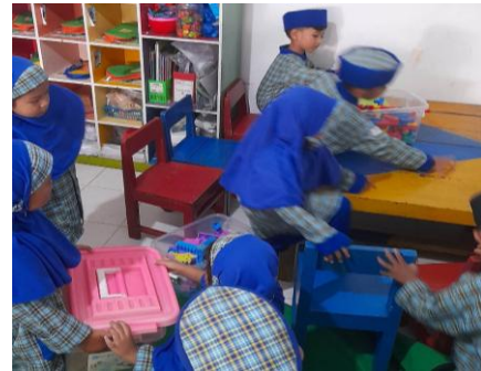
Gambar 5. Anak merapikan mainan setelah digunakan.

Pada indikator menunggu giliran, terjadi peningkatan dengan 5 anak (29%) mulai mau menunggu giliran dan 12 anak (70,58%) selalu sabar menunggu giliran bermain. Disini terlihat anak semakin mampu mengendalikan diri dan menghargai hak teman.