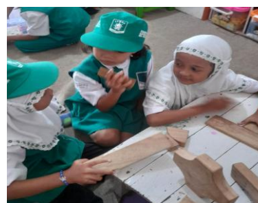
Gambar 2. Anak berbagi mainan dalam permainan Pembangunan.

Pada indikator berbagi alat, mainan, dan makanan, tercatat 13 anak (76,4%) mau berbagi jika di minta, 4 anak (23,5%) sering berbagi secara suka rela. Hal ini menunjukkan bahwa sebagian besar anak mulai mau berbagi, tetapi masih perlu arahan dan pengingat dari guru.