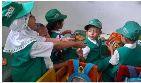
Gambar 3. Anak berbagi makanan saat istirahat

Hasil observasi pada siklus II menunjukkan adanya peningkatan kemampuan empati anak pada hampir seluruh indikator. Pada indikator berbagi alat, mainan, dan makanan, jumlah anak yang mau berbagi jika diminta menjadi 7 anak (41,17%), sedangkan anak yang sering berbagi secara sukarela berjumlah 10 anak (58,8%) Hal ini menunjukkan bahwa anak semakin terbiasa berbagi secara lebih mandiri.