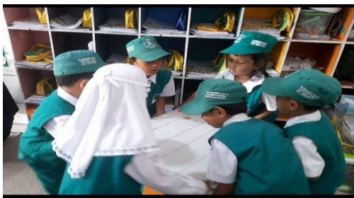
Gambar 4. Anak membantu teman yang kesulitan

Pada indikator membantu teman Sebanyak 9 anak (52,94%) mulai membantu teman yang kesulitan dan 8 anak (47,05%) yang sering membantu teman yang kesulitan. Peningkatan ini menunjukkan bahwa kepedulian anak terhadap teman yang membutuhkan bantuan semakin berkembang.