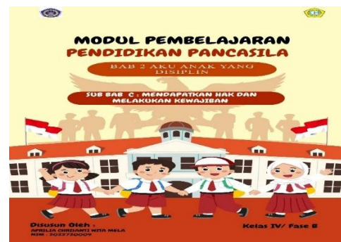
Gambar 1. Tampilan awal modul

Tahap ketiga yaitu Tahap pengembangan format awal produk merupakan langkah lanjutan setelah perencanaan, di mana rancangan awal media pembelajaran mulai diwujudkan dalam bentuk nyata