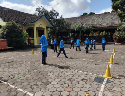
Gambar 2. Implementasi Kearifan Lokal Gobak Sodor

antar siswa. Pembagian strategi mendorong peserta didik untuk mengandalkan kemampuan teman serta menjalankan tugas dengan sungguh-sungguh. Arahan sebelum kegiatan membantu menciptakan koordinasi yang baik. Nilai kerjasama berkembang melalui interaksi yang intens selama permainan.