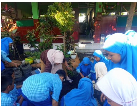
Gambar 2. Penerapan Kegiatan Gotong royong

Pelaksanaan kegiatan kebersihan bersama dan kerja bakti tersebut memperlihatkan adanya pembagian tugas yang disesuaikan dengan jenjang dan kemampuan siswa. Kelas rendah diberikan tugas yang lebih sederhana, seperti membersihkan area sekitar kelas, sedangkan kelas tinggi, termasuk kelas V, memperoleh tanggung jawab yang lebih kompleks, seperti perawatan tanaman atau pengelolaan fasilitas tertentu. Pola ini menunjukkan bahwa implementasi kearifan lokal dilakukan secara bertahap dan proporsional, sehingga siswa belajar bekerja sama sesuai dengan kapasitasnya masing-masing. Selain kegiatan mingguan, pembiasaan gotong royong juga dilakukan melalui piket kelas harian yang menjadi rutinitas siswa dalam menjaga kebersihan ruang belajar. Dengan demikian, nilai gotong royong tidak hanya hadir dalam satu program khusus, tetapi terintegrasi dalam aktivitas harian siswa.