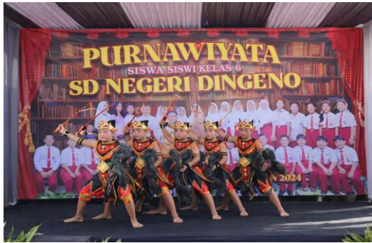
Gambar 3. Siswa mengikuti lomba tari jaranan

Selain itu, penggunaan kostum dan properti tari memberikan pengalaman visual yang memperkaya pemahaman siswa terhadap seni tradisional. Siswa tidak hanya belajar tentang gerakan tari, tetapi juga memahami unsur estetika dan simbolik yang terdapat dalam pertunjukan.