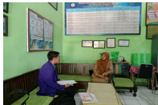
Gambar 1. Wawancara kepala sekolah

Hasil penelitian menunjukkan bahwa Tari Jaranan mengandung nilai-nilai budaya yang relevan dengan pendidikan karakter, seperti disiplin, kerja sama, tanggung jawab, dan keberanian. Proses latihan yang dilakukan secara rutin menuntut siswa untuk hadir tepat waktu, mengikuti arahan pelatih, serta menjaga kekompakan dalam kelompok. Situasi tersebut melatih konsistensi dan tanggung jawab siswa terhadap tugas yang diberikan.