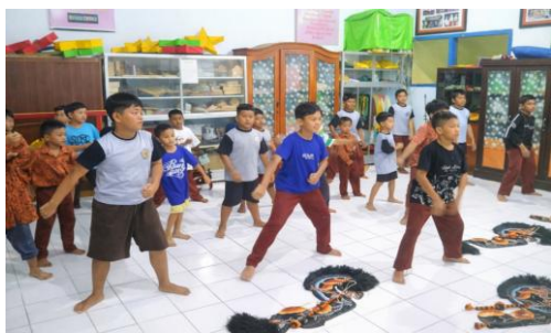
Gambar 2. proses latihan tari Jaranan

Kesadaran budaya merupakan salah satu aspek penting dalam pembentukan identitas siswa sebagai generasi penerus bangsa. Pada tingkat sekolah dasar, pengenalan budaya memiliki peran strategis dalam membentuk pola pikir, sikap, serta nilai-nilai yang dianut oleh siswa.