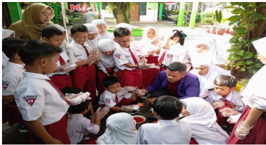
Gambar 1. Praktik membatik

Komponen konstruktivisme, inkuiri, questioning, learning community, modeling , refleksi, dan penilaian autentik diterapkan secara terpadu dalam pembelajaran. Kegiatan diskusi dan kerja kelompok memperkuat interaksi sosial siswa sebagaimana dikemukakan oleh Chrysty & Mataram (2023) bahwa pembelajaran kooperatif dalam kegiatan kelompok dapat meningkatkan hasil belajar sekaligus keterampilan sosial siswa sekolah dasar.