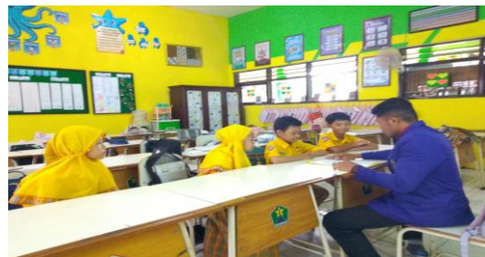
Gambar 2. Wawancara siswa

Guru juga berfungsi sebagai model dalam menunjukkan sikap menghargai budaya daerah. Keteladanan tersebut memengaruhi sikap siswa terhadap pelestarian budaya, sebagaimana dijelaskan oleh Nadiyah dkk (2026) bahwa pendidikan berbasis budaya lokal dapat memperkuat identitas sosial serta menumbuhkan sikap apresiatif siswa terhadap warisan budaya daerah. Sementara itu, siswa berperan aktif dalam diskusi, praktik, dan presentasi hasil karya.