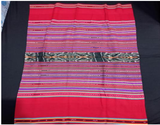
Gambar 3. Pakaian adat Tais Marobo

dengan tokoh adat dan orang tua untuk memastikan nilai-nilai kearifan lokal tetap terjaga dan dipahami oleh generasi muda.