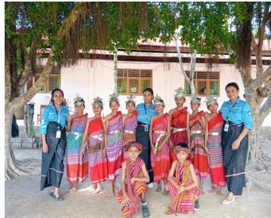
Gambar 2. Penggunaan pakaian adat Tais Marobo

Sebagian besar siswa menunjukkan rasa bangga saat mempelajari pakaian adat Tais Marobo dan memiliki keinginan untuk melestarikannya kepada generasi selanjutnya. Mereka juga berharap pembelajaran mengenai Tais Marobo terus dilaksanakan secara berkelanjutan di sekolah serta dipromosikan melalui kegiatan budaya yang melibatkan masyarakat luas.