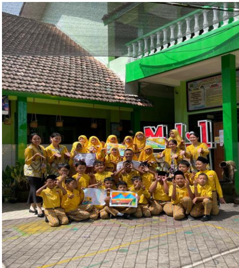
Gambar 2. kegiatan membuat poster.

Hasil penelitian menunjukkan bahwa implementasi pembelajaran di kelas III telah mengarah pada penguatan 8 Dimensi Profil Lulusan. Dimensi keimanan dan ketakwaan tercermin dalam pembiasaan doa sebelum dan sesudah pembelajaran. Dimensi kewargaan tampak melalui partisipasi siswa dalam kegiatan upacara bendera serta kepatuhan terhadap aturan sekolah. Sementara itu, dimensi penalaran kritis dan kreativitas berkembang melalui kegiatan pemecahan masalah, diskusi, dan pembuatan karya yang relevan dengan materi pembelajaran.