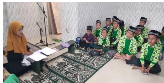
Gambar 1. Proses Pembelajaran

Setelah seluruh data terkumpul, analisis data dilakukan dengan menggunakan metode analisis deskriptif kualitatif, yaitu dengan mengorganisasi, mengelompokkan, serta mengkategorikan data yang diperoleh dari hasil observasi, wawancara, dan dokumentasi. Data yang telah dikategorikan kemudian dianalisis secara mendalam untuk menemukan tema-tema utama yang berkaitan dengan kesulitan belajar peserta didik dalam pembelajaran Al-Qur'an. Temuan-temuan tersebut selanjutnya dianalisis untuk memberikan gambaran yang lebih jelas mengenai faktor-faktor yang menyebabkan kesulitan belajar peserta didik serta memberikan wawasan yang dapat digunakan untuk meningkatkan kualitas pembelajaran Al-Qur'an di Taman Pendidikan Al-Qur'an (Indana and Febrianti, 2023).