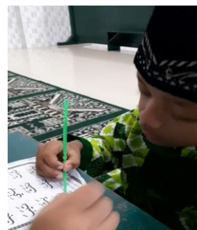
Gambar 2. Proses Pembelajaran