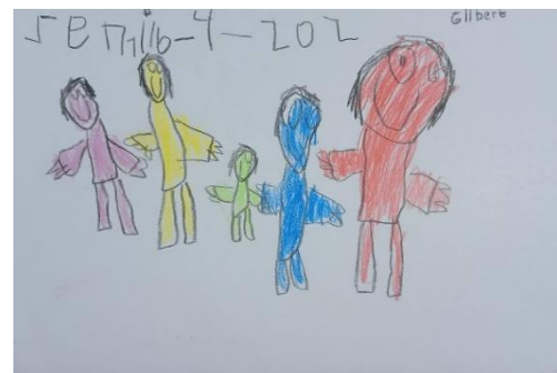
Gambar 3. Dokumentasi karya A2

Pada karya kedua ditemukan adanya perbedaan ukuran, warna, dan tekanan garis antar figur manusia. Figur tertentu digambarkan lebih besar, lebih tegas, atau menggunakan warna yang mencolok dibandingkan figur lainnya. menggunakan perbedaan skema warna yang paling lengkap.