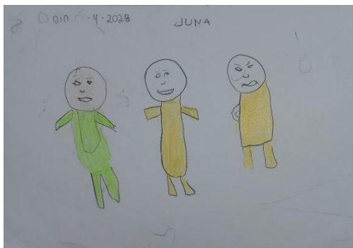
Gambar 4. Dokumentasi karya A3

Selanjutnya pada gambar A3 ditemukan pula karya yang menampilkan beberapa figur dengan ekspresi wajah yang berbeda-beda marah, dan tertawa. Perbedaan ini menunjukkan kemampuan anak dalam membedakan kondisi emosional antar individu di sekitarnya.