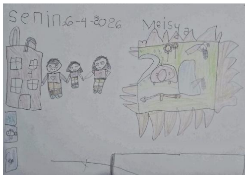
Gambar 2. Dokumentasi A1

Gambar pertama menunjukkan kompleksitas yang cukup tinggi untuk usia 6 tahun. Terdapat gambar rumah dengan