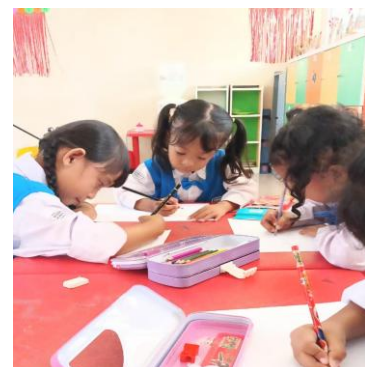
Gambar 6. Dokumentasi proses berkarya