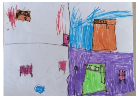
Gambar 5. Dokumentasi karya A4

Pada karya keempat menggambarkan kondisi empat setting dirumah yang berbeda dengan garis hitam yang memisahkan batas antara ruangan satu dengan yang lain. Penggambaran digambar dari tampak atas sehingga menimbulkan kesan luas dan terlihat semua. Setiap ruangan memiliki objek tersendiri, mulai dari kasur dan lemari dengan warna dominan ungu, hijau dan coklat.