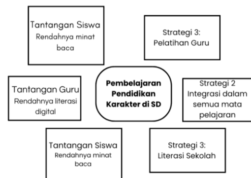
Gambar 1: Tantangan dan strategi pembelajaran Pendidikan Karakter di SD