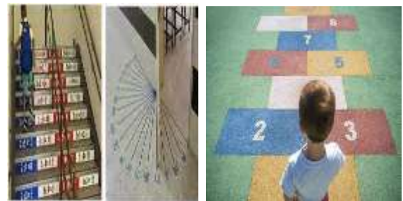
Gambar 3. Tampilan Numerasi di Kelas

Kegiatan ini dimulai dengan mempersiapkan bahan untuk penyuluhan yakni mempersiapkan PowerPoint yang berisi memberikan informasi tentang pentingnya numerasi, menciptakan suasana numerasi dilingkungan sekolah dan langkah-langkah menyelesaikan numerasi tipe HOTS. Kemudian dilanjutkan dengan komunikasi dengan pimpinan MIN Baubau sebagai mitra kerjasama dalam pengabdian ini. Kegiatan ini dilaksanakan bersamaan dengan PLP I FKIP UM Buton. Persiapan kegiatan ini dimulai dengan mengobservasi terlebih dahulu lingkungan sekolah baik di luar maupun didalam kelas mengenai numerasi dengan tujuan untuk dapat mengetahui seberapa besar pengembangan numerasi dilingkungan sekolah dilakukan. Hasil observasi ini yakni dilingkungan sekolah MIN Baubau masih identik dengan literasi dan hamper sama sekali budaya numerasi tidak nampak dilingkungan sekolah. Persiapan ini juga mengkoordinasikan dengan pimpinan MIN Baubau mengenai waktu dan tempat kegiatan serta sasaran kegiatan ini yakni para guru kelas MIN Baubau. Pemilihan guru kelas karena guru kelas erat kaitannya dengan pembelajaran matematika di kelas. Selain itu tim juga melakukan penyusunan materi yang berisi pentingnya numerasi pada era digital, menciptakan suasana numerasi dilingkungan sekolah dan juga langkah-langkah menyelesaikan numerasi tipe HOTS.