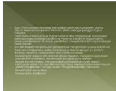
Gambar 1. PPT Pentingnya Numerasi

tan ini adalah seluruh guru kelas MIN Baubau. Metode yang digunakan adalah model partisipatif aktif berupa penyuluhan kepada guru-guru dan diskusi. Pada proses penyampaian informasi memanfaatkan PowerPoint yang berisi informasi mengenai pentingnya numerasi di era digital, menciptakan suasana numerasi dilingkungan sekolah dan langkah-langkah menyelesaikan numerasi tipe HOTS. Program penyuluhan ini berlangsung selama 2 jam yang bertempat di MIN Baubau. Kegiatan ini diawali dengan persiapan dan perencanaan dengan berkoordinasi terlebih dahulu dengan pimpinan dan para guru MIN Baubau. Kegiatan ini dilaksanakan dengan tatap muka langsung dengan para guru di MIN Baubau yang dilaksanakan di dalam ruang kelas, dengan tahapan memberikan informasi tentang pentingnya numerasi, menciptakan suasana numerasi dilingkungan sekolah dan langkah-langkah menyelesaikan numerasi tipe HOTS serta selanjutnya dilakukan diskusi dengan para guru MIN Baubau.