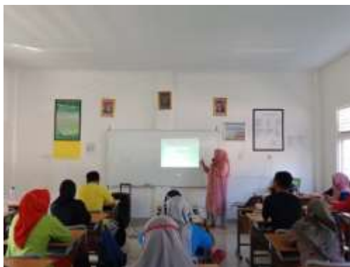
Gambar 5. Pemaparan Numerasi dalam Meningkatkan HOTS

Setelah pemaparan oleh pemateri telah selesai dilaksanakan, maka dilakukan kegiatan diskusi mengenai bagaimana menumbuhkan kemandirian budaya numerasi di lingkungan sekolah dan bagaimana kiat-kiat penyelesaian soal-soal HOTS dengan dimulai dari membiasakan numerasi pada proses pembelajaran. Terdapat beberapa guru yang mengajukan pertanyaan dan juga menceritakan kesulitan-kesulitan pembelajaran numerasi yang terjadi di dalam kelas. Penguatan kembali mengenai pentingnya numerasi dalam meningkatkan Higher Order Thinking Skill (HOTS) siswa sekolah dasar di era digital dengan cara membudayakan lingkungan dan kegiatan numerasi baik di dalam maupun di luar kelas. Selanjutnya mengingatkan guru untuk tetap terus memotivasi siswa dalam proses pembelajaran dan menggunakan berbagai macam model pembelajaran agar meningkatkan Higher Order Thinking Skill (HOTS) dapat dilaksanakan dengan baik dalam proses pembelajaran.