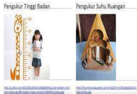
Gambar 2. Tampilan Numerasi di Kelas