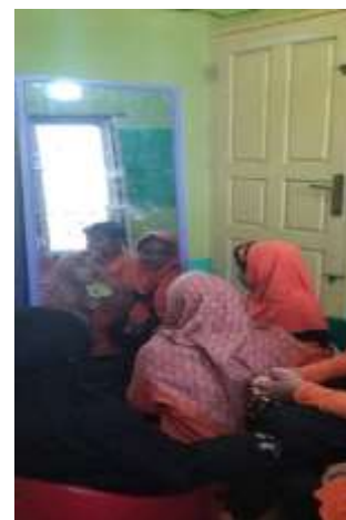
Gambar 3. Penerapan Kartu Sikuen dan Mimik Wajah Dengan Durasi 10 Menit Untuk Masing-Masing Anak

Dari grafik I dapat dilihat adanya peningkatan skor ketuntasan kelas dari pra siklus, siklus I dan siklus II. Sebelum diberikan tindakan didapatkan hasil nilai ketercapaian 20%, kemudian setelah diterapkan penggunaan kartu sikuen dan latihan mimik wajah saat siklus I terjadi peningkatan nilai ketercapaian menjadi 60%, kemudian dilakukan perbaikan saat siklus II skor ketuntasan menjadi 80% berada pada kualifikasi sangat baik dan pelaksanaan tindakan dinyatakan berhasil.