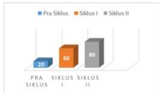
Gambar 2. Grafik Ketuntasan Kelas

Dari grafik I dapat dilihat adanya peningkatan skor ketuntasan kelas dari pra siklus, siklus I dan siklus II. Sebelum diberikan tindakan didapatkan hasil nilai ketercapaian 20%, kemudian setelah diterapkan penggunaan kartu sikuen dan latihan mimik wajah saat siklus I terjadi peningkatan nilai ketercapaian menjadi 60%, kemudian dilakukan perbaikan saat siklus II skor ketuntasan menjadi 80% berada pada kualifikasi sangat baik dan pelaksanaan tindakan dinyatakan berhasil.