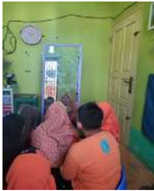
Gambar 1. Penggunaan Kartu Sikuen dan Latihan Mimik Wajah