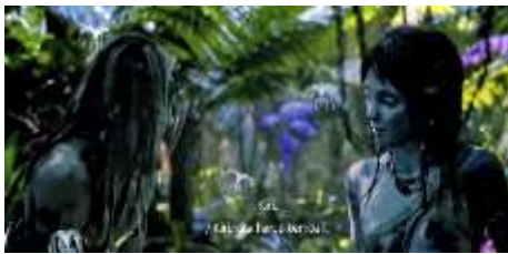
Gambar 3. Cuplikan adegan 32

Level representasi: Teknik kamera yang digunakan adalah eye level , group shot , mid shot , dan follow . Teknik pencahayaan yang digunakan adalah high key level .