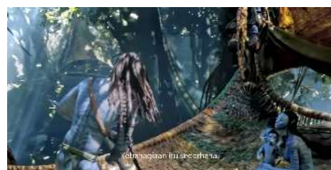
Gambar 2. Cuplikan adegan 2

Penelitian ini hanya difokuskan pada adegan-adegan yang mewakili representasi nilai keluarga oleh keluarga inti dari Jake Sully yang terdiri dari Sully (ayah), Neytiri (ibu), Neteyam (anak pertama), Lo'ak (anak kedua), Tuk (anak ketiga), dan Kiri (anak adopsi).