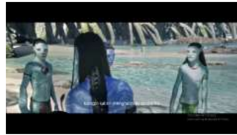
Gambar 4. Cuplikan adegan 61

Level representasi: Teknik kamera yang digunakan adalah eye level , full shot , two shot , dan medium close up . Pencahayaan yang digunakan adalah high key lighting dengan exposure rendah yang menciptakan suasana serius dan mencekam. Didukung dengan efek suara burung sekilas dan suara hembusan napas yang menunjukkan bahwa mereka sedang berada dalam keadaan yang tidak aman dan membahayakan keselamatan mereka.