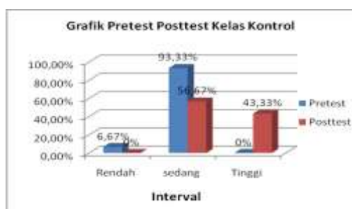
Gambar 1. Grafik Pretest Posttest Kelas Kontrol

Berdasarkan Tabel 2 diketahui bahwa respon responden terhadap kemampuan berpikir kreatif sesudah pembelajaran dimulai dengan menggunakan model pembelajaran konvensional sebanyak 17 orang berada dalam kategori sedang sebesar 56,67%. Dengan demikian dapat diketahui bahwa tingkat kemampuan berpikir kreatif siswa dengan menggunakan model pembelajaran konvensional sudah ada peningkatan namun masih perlu ditingkatkan lagi. Untuk lebih jelasnya telah disajikan hasil pretest posttest kelas kontrol dalam grafik sebagai berikut: