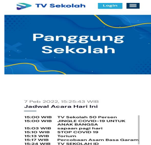
Gambar 3. Fitur Panggung Sekolah

kegiatan sekolah yang menjadi program-program unggulan oleh sekolah tersebut, programnya dapat disusun oleh sekolah mulai hari senin sampai hari minggu.