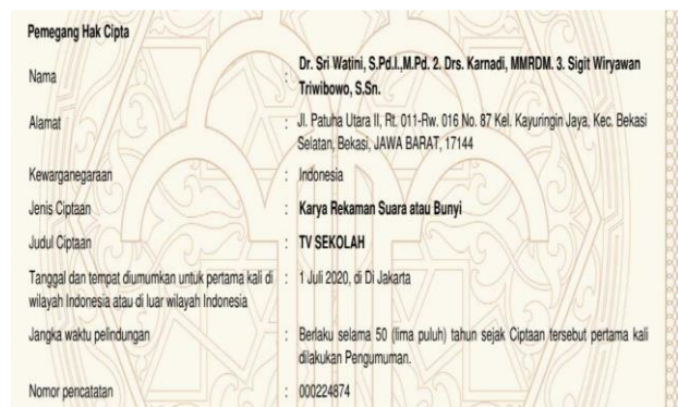
Gambar 1. Hak Cipta TV Sekolah

Menurut William Arms (2007) mengatakan bahwa perpustakaan digital adalah kumpulan informasi yang tersusun baik beserta layanan-layanan yang disediakan dan disimpan dalam format digital untuk diakses melalui jaringan komputer. Ridwan Siregar (2004) mengatakan bahwa perpustakaan digital adalah lingkungan perpustakaan di mana berbagai objek informasi seperti dokumen, gambar, suara dan video yang disimpan dan diakses dalam bentuk digital. Sedangkan Perpustakaan digital dalam fitur TV Sekolah yang dikembangkan oleh Sri Watini, dkk (2020) bahwa merupakan fitur TV Sekolah yang menyajikan tayangan-tayangan vidio edukatif kiriman siswa dan guru dari seluruh Indonesia. Video akan didokumentasikan ke dalam file Dokumen Perpustakaan Digital TV Sekolah yang dapat diakses oleh siswa-siswi maupun guru baik dari sekolah yang bersangkutan maupun dari sekolah lain. TV Sekolah yang dikembangkan oleh Sri Watini dkk, sudah memiliki Hak Cipta yang telah terdaftar hak paten no. EC00202040424, tanggal 15 Oktober 2020 dengan Nomor pencatatan 000224874, serta telah terdaftar dalam PSE dengan nomor 002009.01/DJAI.PSE/01/2022, pada 25 Januari 2022 sebagai TV Sekolah Wahana Kreasi.