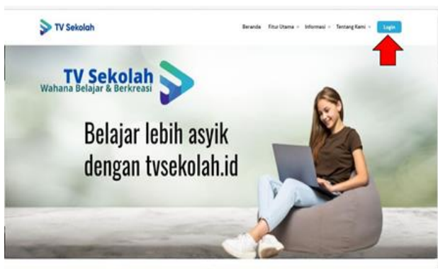
Gambar 2. Buka halaman tvsekolah.id: Klik Login