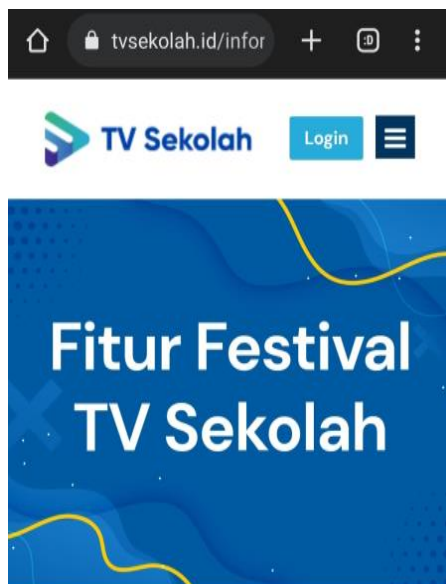
Gambar 5. Gambar Fitur Festival TV Sekolah

Fitur Festival TV Sekolah sebagai aplikasi yang menyajikan gamifikasi atau teknik desain permainan, yang menyediakan wahana kompetisi baik bagi lembaga/sekolah, guru maupun siswa secara positif baik dilaksanakan di tingkat Kabupaten/kota, provinsi, nasional, ASEAN maupun Internasional, sehingga dapat mengakomodasi munculnya potensi-potensi hebat, berkarakter, kompetitif dan professional. Kemampuan membuka diri dan berkompetisi secara terbuka saat ini akan menjadi wujud eksistensi seseorang dalam hal ini baik siswa maupun guru di sekolah. Semoga Festival TV Sekolah sebagai fitur yang menyediakan kompetisi dapat mengakomodasi munculnya potensi-potensi anak yang baik.