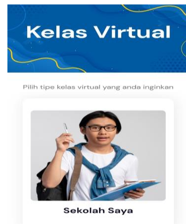
Gambar 6. Gambar Fitur Kelas Virtual

Fitur ini menjadi kelas unggulan TV Sekolah yang telah diluncurkan setahunnya yang lalu tepatnya pada tanggal 1 Januari 2021, kelas Virtual ini berbasis Program Micro Learning yang disusun oleh guru dalam waktu yang singkat untuk persiapan proses pembelajaran daring. Dalam format program ini diharapkan dapat mengakomodasi berbagai gaya belajar siswa baik visual, audioty maupun kinestetik.