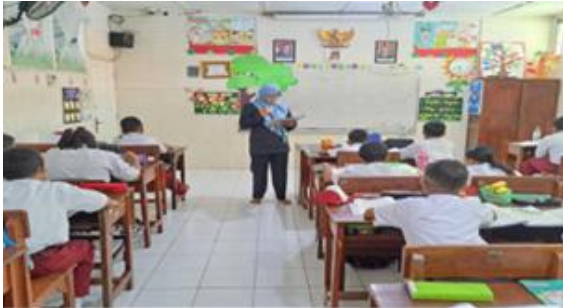
Gambar 2. Guru Menentukan Pertanyaan Mendasar

narasumber AF menjelaskan dari pertanyaan yang diberikan “Apakah kamu mengerti tujuan proyek yang diberikan guru?” narasumber AF menguraikan jawaban “saya mengerti, bu SW menjelaskan pelajaran Bahasa Indonesia yang ada di buku paket materi membuat surat”. Peserta didik berinisial AF ini menangkap dan menyimak apa yang disampaikan oleh guru.