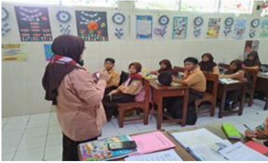
Gambar 4. Merancang Jadwal Kegiatan Proyek

Pada tahap keempat memonitoring keaktifan dan perkembangan proyek: pada tahap ini guru berkeliling memastikan peserta didik tidak mengalami kesulitan dalam pengerjaan proyek. Peserta didik terlihat sangat antusias dalam proyek ini kerja sama yang dilakukan dengan kelompok membuat tugas proyek menjadi ringan.