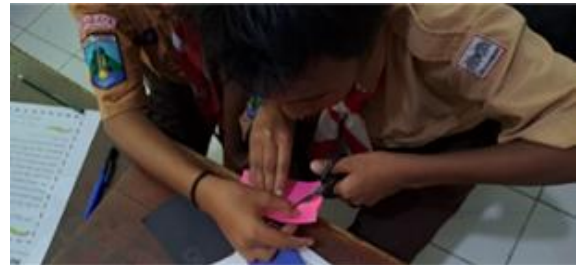
Gambar 3. Mendesain Produk

tugasmu dalam kelompok” narasumber menguraikan jawaban “tugas saya dalam kelompok ini, menggunting untuk hiasan yang akan ditempel di amplop”. Hasil wawancara tersebut peserta didik yang berinisial BAA bersemangat dalam pengerjaan proyek, dengan itu peserta didik menunjukkan bahwa gaya belajar BAA kinestetik.