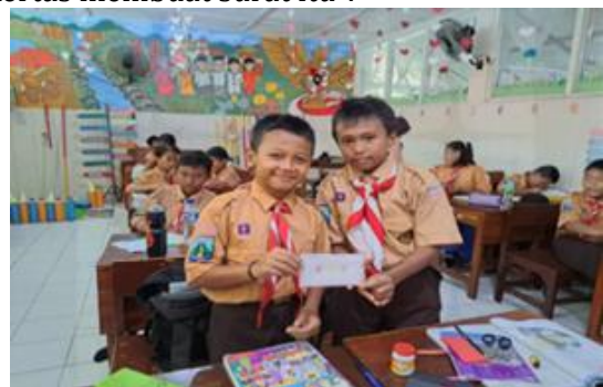
Gambar 6. Menguji Hasil Proyek

Berdasarkan hasil wawancara dengan narasumber guru kelas yang berinisial SW dengan pertanyaan "Bagaimana Ibu memastikan bahwa hasil proyek sesuai dengan tujuan pembelajaran?" narasumber menguraikan jawaban "saya menilai berdasarkan rubrik, dari cara mempresentasikan, kerapihan dalam proyek, struktur dalam pembuatan surat". Wawancara dengan narasumber peserta didik yang berinisial AF "Apakah kamu merasa puas dengan hasil proyek yang kamu buat? Mengapa?" narasumber menguraikan jawaban "saya sangat puas karena saya bisa menghias, menggambar, menggunting dan mewarnai di kertas membuat surat itu".