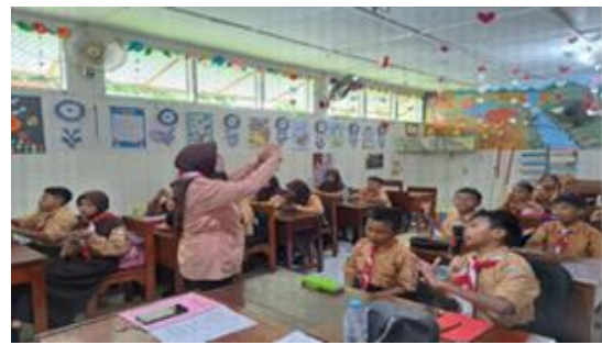
Gambar 7. Mengevaluasi

Berdasarkan hasil wawancara narasumber guru kelas berinisial SW dengan pertanyaan “Bagaimana Ibu melakukan refleksi akhir bersama setelah proyek selesai?” narasumber menguraikan jawaban “saya melakukan sesi tanya jawab dengan peserta didik terkait apa yang telah dilakukan dan apa yang telah dihasilkan dari materi membuat surat”. Wawancara dengan narasumber peserta didik berinisial ANR, CISR, BAA, NIZ, dan AF dengan pertanyaan “Apa hal penting yang kamu pelajari dan hal apa yang kamu sukai dari tugas proyek hari ini?”. Narasumber ANR dan CISR menguraikan jawaban “hal penting yang dipelajari dari struktur membuat surat dan hal aku sukai dari tugas proyek ini aku bisa menggambar sesuai apa yang aku mau dan membuat hiasan menggunakan origami untuk menghias amplop”. Narasumber BAA dan DLZ menguraikan jawaban “hal pentingnya menghafal struktur surat dan hal yang paling aku sukai dari tugas proyek ini aku bisa membacakan hasil surat aku di depan kelas dengan percaya diri dan aku menghias surat dengan cantik.” Narasumber AF menguraikan jawaban “hal penting yang dipelajari cara menulis surat dengan baik dan hal yang aku sukai aku bisa menggambar di kertas surat, aku bisa membacakan surat yang sudah aku buat sama temanku, dan aku bisa menghias surat dengan mewarnai dengan spidol dan aku bisa menempelkan origami untuk hiasan di suratku.”