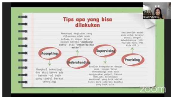
Gambar 2. Pemberian tips mewujudkan generasi digital native