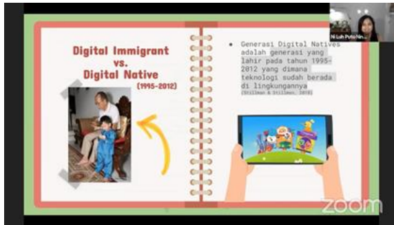
Gambar 1. Pemaparan materi perbedaan generasi digital immigrant dan digital native

Sebagai pembuka, disajikan perbedaan antara generasi digital immigrant dan generasi digital native . Selanjutnya, diberikan tips untuk mewujudkan generasi digital native Indonesia agar dapat menjadi productive digital citizens masa depan. Setelah itu, peserta kegiatan menyimak simulasi penggunaan aplikasi atau website untuk membantu pembelajaran anak-anaknya yang nantinya para peserta dapat melakukan praktik secara mandiri.